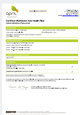
VOTRE CERTIFICAT D'ADHÉSION VALANT ATTESTATION D'ASSURANCE,