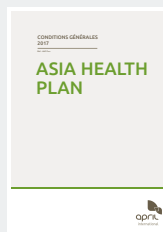
VOS CONDITIONS GÉNÉRALES DÉTAILLANT LE FONCTIONNEMENT DE VOTRE CONTRAT,